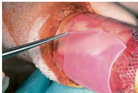
Abb. 1: Das robuste Hautkonstrukt bei der Applikation.