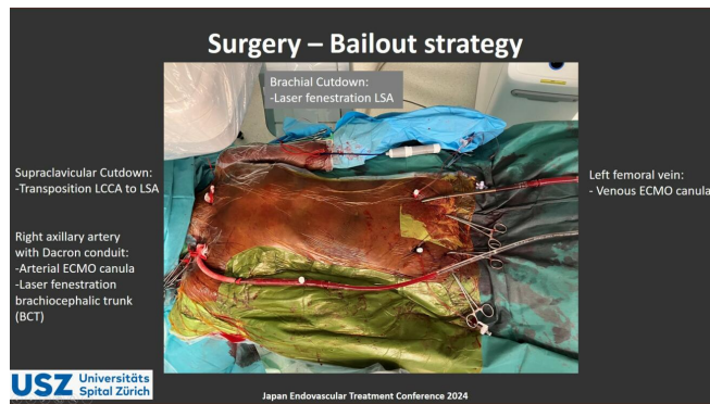
Operations-Set-up für den Eingriff

Die rechte A. axillaris wurde für den arteriellen ECMO-Schenkel und die linke V. femoralis für die venöse ECMO-Kanülierung verwendet. Sodann erfolgte eine Transposition der linken A. carotis communis auf die linke A. subclavia und eine thorakale Aortenstentprothese wurde unter kardialem Rapid-Overpacing freigesetzt. Dann verwendeten wir die Technik der in-situ Laserfenestrierung, um nachfolgend Bridging Stents in den Truncus brachiocephalicus und die linke A. subclavia zu platzieren.