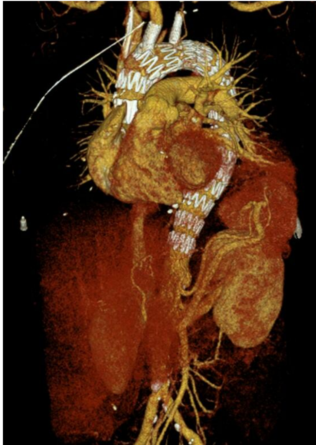
3 D-Rekonstruktion der postoperativen CT-Angiographie

Ich habe den Kongress aufgrund der Breite an Spezialist:innen, der Internationalität als auch der Qualität und Quantität der Vorträge als hochkarätig erlebt und konnte selbst viel Neues lernen und für meinen klinischen Alltag mitnehmen. Das Programm fand durchgehend pausenlos von früh bis spät in mehreren Hörsälen gleichzeitig statt. Dadurch fiel es mir sehr schwer, mich für einen Hörsaal zu entscheiden, zumal die Themenblöcke von der Shuntchirurgie über die endovaskuläre Therapie der pAVK bis zur endovaskulären Aortentherapie reichten. Die Vorträge wurden grösstenteils auf Englisch, teilweise aber auch auf Japanisch gehalten. Die japanische Kultur war ebenso allgegenwärtig. Beispielsweise fanden sich bereits am Eingang sogenannte «Hakata-Ningyo», traditionell handgefertigte Keramikpuppen aus Fukuoka.