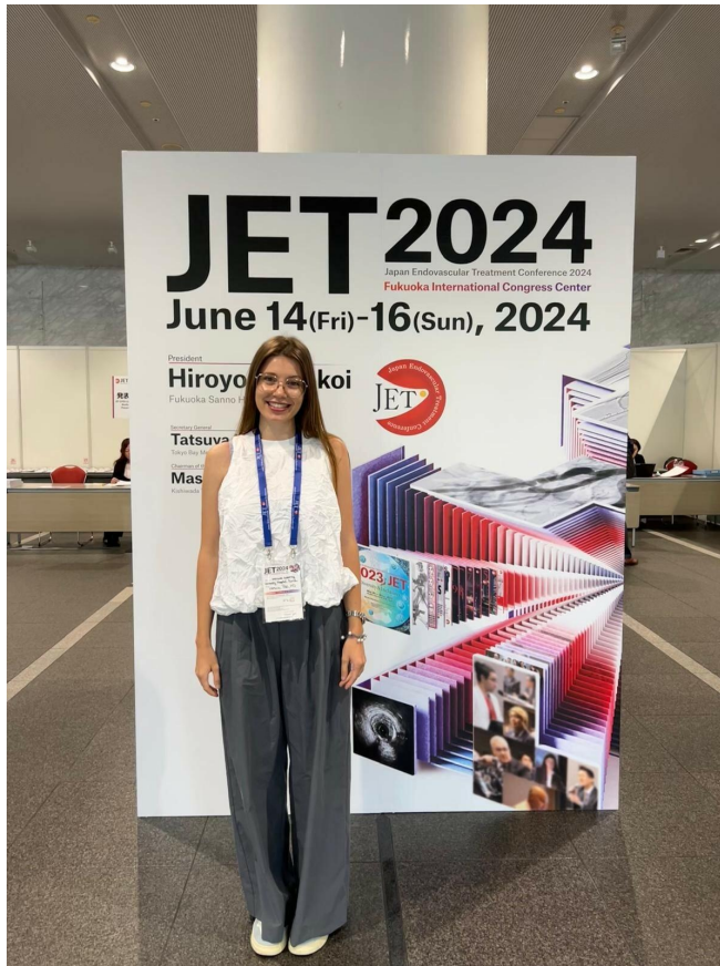
Meine Erleichterung und Freude nach dem gehaltenem Vortrag