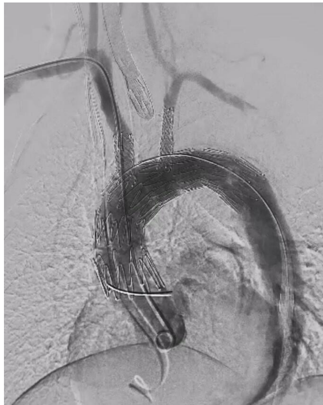
Intraoperative Abschlussangiographie der 2-fach in situ Laserfenestrierten Aortenstentprothese

Die rechte A. axillaris wurde für den arteriellen ECMO-Schenkel und die linke V. femoralis für die venöse ECMO-Kanülierung verwendet. Sodann erfolgte eine Transposition der linken A. carotis communis auf die linke A. subclavia und eine thorakale Aortenstentprothese wurde unter kardialem Rapid-Overpacing freigesetzt. Dann verwendeten wir die Technik der in-situ Laserfenestrierung, um nachfolgend Bridging Stents in den Truncus brachiocephalicus und die linke A. subclavia zu platzieren.