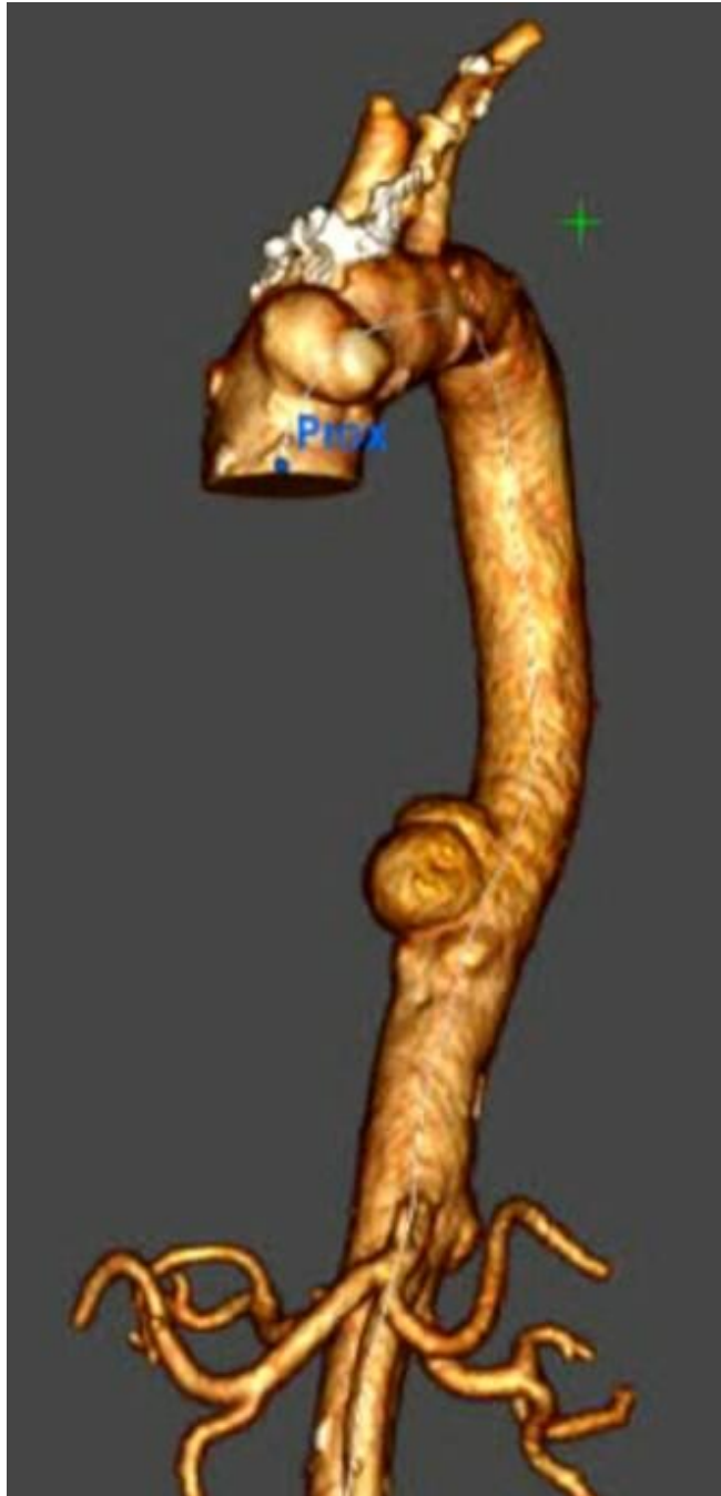
3-D-Darstellung der mykotischen Aortenaneurysmata am Aortenbogen sowie der Aorta descendens

Nebenbefundlich bestand eine Pneumokokkeninfektion mit bereits neurochirurgisch sanierten intraspinalen Empyemen, sodass von einer hämatogenen Streuung der Keime auszugehen war. Eine offene Operation wäre bei dieser Patientin mit einem zu hohen perioperativen Risiko verbunden gewesen. Zudem bestand aufgrund der raschen Größenprogredienz der Aneurysmata eine hohe Dringlichkeit zur zeitnahen Versorgung. Wir konnten die Bestellung eines Custom-Made-Devices nicht abwarten und mussten eine Bail-out-Strategie entwerfen. Im Rahmen der präoperativen Recherche entdeckten wir einen schwedisch-japanischen Case-Report: «Urgent endovascular mycotic aortic arch aneurysm repair using in situ laser fenestration and selective arterial perfusion with venoarterial extracorporeal membrane oxygenation» von Shebab et al, in welchem ein Aneurysma des Aortenbogens mithilfe von in-situ Laserfenestrierung unterstützt durch zerebrale ECMO-Kanülierung erfolgreich endovaskulär saniert wurde. Unser Operations-Set-up gestalteten wir ähnlich.